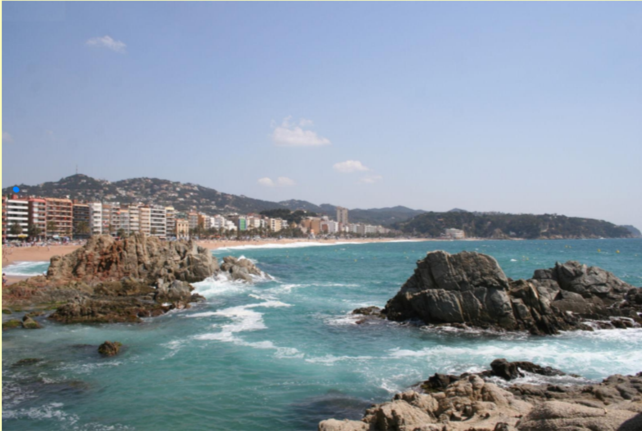
Plage de la Costa Brava http://imagine.ac-montpellier.fr/pmi_affiche_image1.php?id=48

Entourer les différents plans de cette photo et les légender.